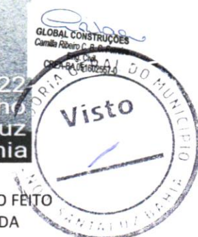
FOTO 02 – PAVIMENTAÇÃO EM CONCRETO, COM ESPESSURA DE 7 CM, COM ACABAMENTO FEITO UTILIZANDO ALISADORA DE CONCRETO (HELICOPTERO), INCLUIDO TELA DE AÇO SOLDADA

25 de jul. de 2024 15:21:22 Avenida Luiz Aristide de Carvalho Santaluz Bahia