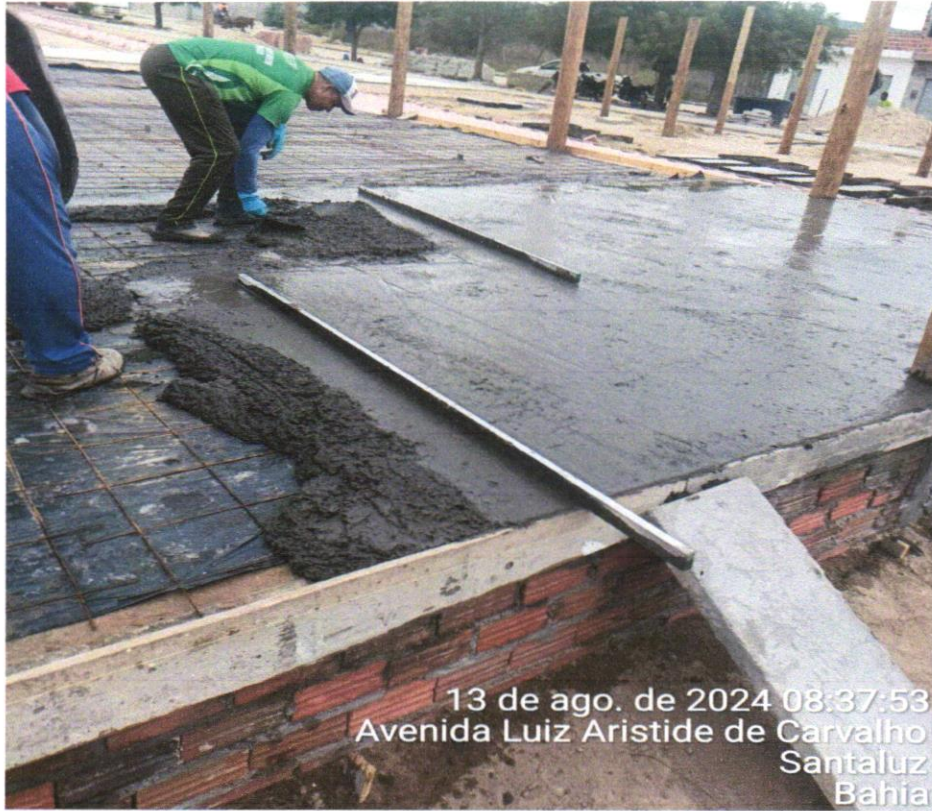
FOTO 09 –FORNECIMENTO E INSTALAÇÃO DE TELA AÇO SOLDADA NERVURADA CA-60, MALHA 15X15CM, FERRO 4.2MM, PAINEL 2X3M, (1,50KG/M 2 ), MALHA POP REFORÇADA GERDAU OU SIMILAR