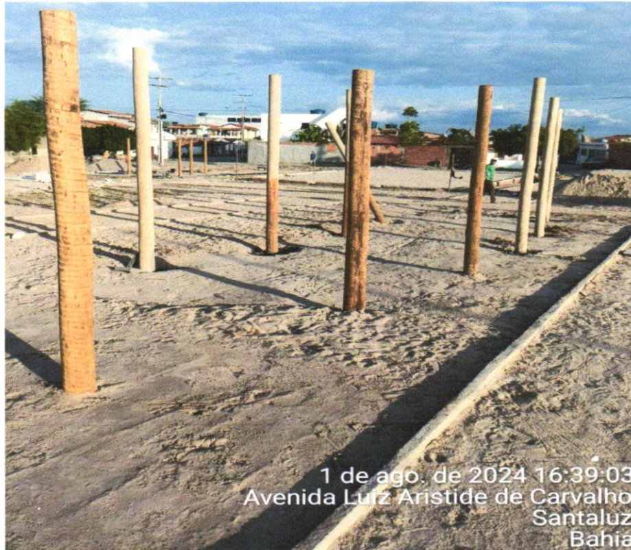
FOTO 07 – Assentamento de peças de eucalipto tratado, d=19 a 22cm para confecção de pergolado (ref:obra Sergipetec)