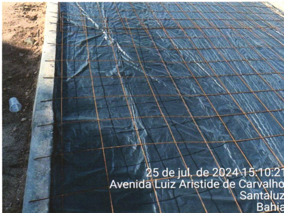
FOTO 03 - FORNECIMENTO E INSTALAÇÃO DE TELA AÇO SOLDADA NERVURADA CA-60, MALHA 15X15CM, FERRO 4.2MM, PAINEL 2X3M, (1,50KG/M 2 ), MALHA POP REFORÇADA GERDAU OU SIMILAR.